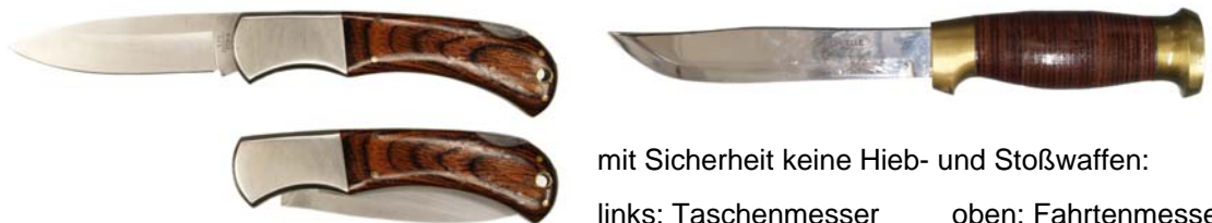
mit Sicherheit keine Hieb- und Stoßwaffen: links: Taschenmesser oben: Fahrtenmesser

Die als Jagdnicker bezeichneten feststehenden Messer mit einseitig geschliffener Klinge und typischer Griffform (oft mit Horngriffen) stellen heute übliche Schneidwerkzeuge zum Aufschärfen 4 und Abhäuten von Wild dar und sind demnach nicht dazu bestimmt, die Angriffs- oder Abwehrfähigkeit von Menschen herabzusetzen. Diese Beurteilung gilt auch für Hirschfänger, die in der heutigen Zeit allenfalls noch als Bestandteil einer Jagd- oder Forstuniform (Zierrat) Verwendung finden.