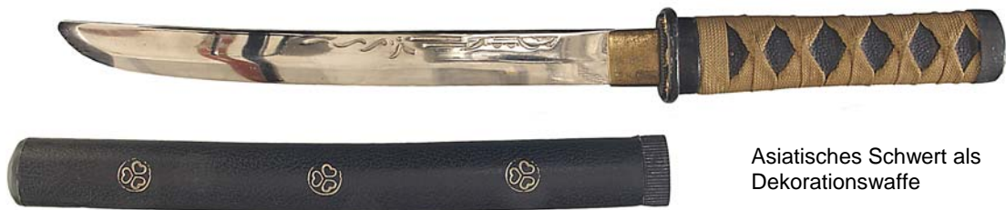
Asiatisches Schwert als Dekorationswaffe

Keine Hieb- und Stoßwaffen sind in der Regel solche Geräte, die zwar Hieb- und Stoßwaffen (§ 1 Abs. 2 Nr. 2 Buchstabe a WaffG i.V.m. Anlage 1 Abschnitt 1 Unterabschnitt 2 Nr. 1.1 zum WaffG) nachgebildet, aber wegen abgestumpfter Spitzen und stumpfer Schneiden offensichtlich nur für den Sport (z.B. Sportflorete, Sportdegen, hingegen nicht geschliffene Mensurschläger), zur Brauchtumpflege (z. B. historisch nachgebildete Degen, Lanzen) oder als Dekorationsgegenstand (z. B. Zierdegen, Dekorations-schwerter) geeignet sind.