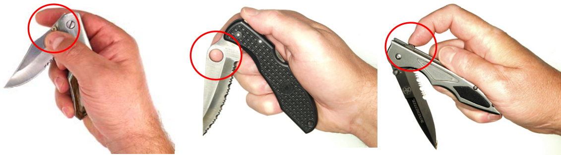
Einhandmesser mit Öffnungsstift